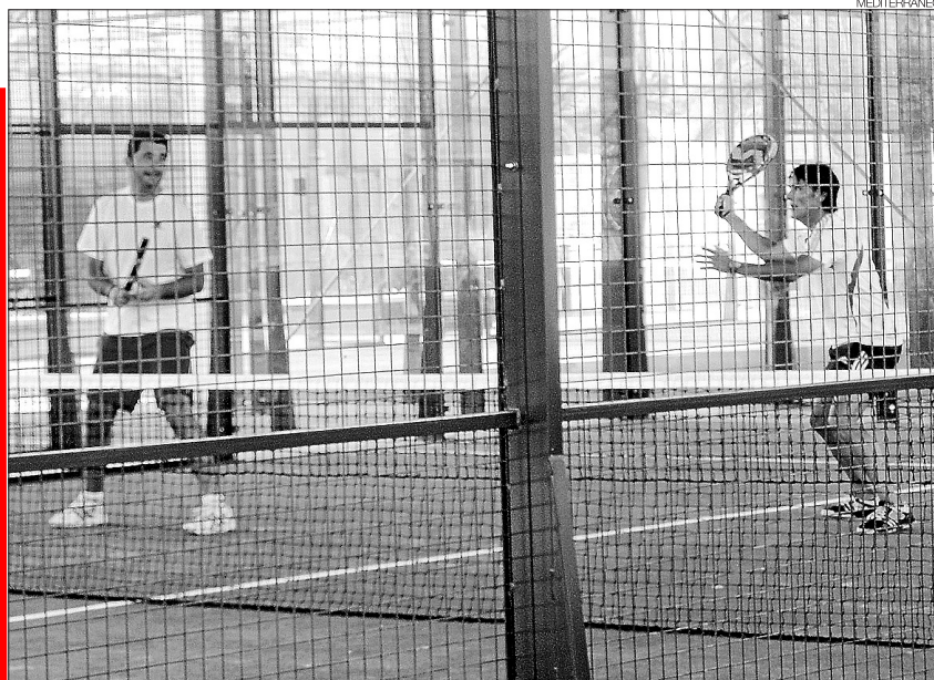
► El pádel volverá a ser protagonista en la máxima expresión este fin de semana en Impala.

SISTEMA DE COMPETICIÓN // El torneo consistirá en un abierto modalidad americano. Esto es, un open que comienza y finaliza el mismo día, y los partidos suelen jugarse a un solo set, enfrentándose todos contra todos. Dependiendo de la inscripción, las parejas suelen englobarse por grupos, que van disputando los